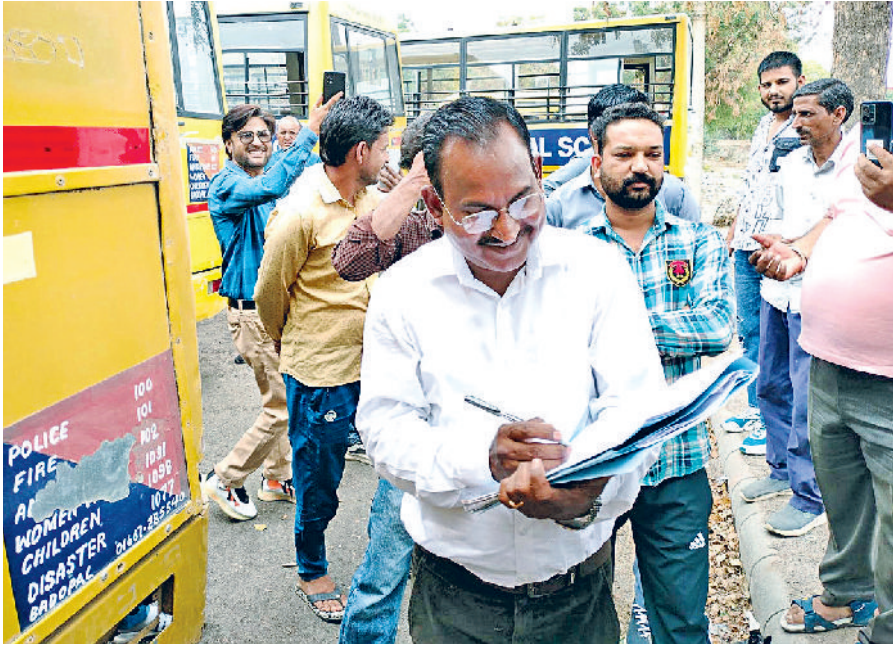
फतेहाबाद। पासिंग के लिए स्कूल बसों की जांच करते कर्मचारी।

कनीना स्कूल बस हादसे के बाद अभी भी स्कूल संचालक सबक नहीं ले रहे हैं। काफी स्कूल बसों में अभी भी नियम कायदे पूरे नहीं किए जा रहे। इतना ही नहीं ट्रैफिक पुलिस द्वारा जारी सखी के दौरान एक और बस चालक शराब के नशे में मिला, जिस पर बस को इंपाऊंड कर लिया गया। वह बस फतेहाबाद के बहबलपुर गांव स्थित मुख्तयार सिंह मैमोरियल कॉलेज को बताई गई है। ट्रैफिक पुलिस द्वारा आज चलाए गए अभियान के दौरान इस कॉलेज सहित 22 स्कूल वाहनों को परमिट न होने, फिटनेस पास न होने आदि कारणों के चलते इंपाऊंड कर दिया, जबकि अन्य कमियों के चलते 71 स्कूल बसों के चालान किए गए। इनमें फतेहाबाद, भूना, भट्ट भी शामिल हैं। इंपाऊंड होने वाले वाहनों में 15 टाटा एस हैं, जो अवैध रूप से चल रहे थे। फतेहाबाद में ट्रैफिक पुलिस लगातार स्कूल बसों की चेकिंग कर रही है। आज लाल बत्ती चौक व पुराना बस स्टैंड क्षेत्र में