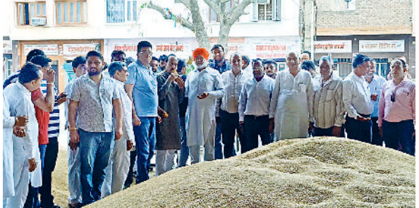
रतिया। गेहूं खरीद कार्य का निरीक्षण करते हुए व्यापार मंडल के प्रधान।

संबंधित शिकायत कर सकता है। लोकसभा के रिटर्निंग अधिकारी ने नोडल अधिकारी को निर्देश दिये कि लोकसभा चुनाव के दौरान आदर्श आचार संहिता की उल्लंघना करने वाले व्यक्ति पर तुरंत कार्यवाही अमल में लाई जाए। उन्होंने आम नागरिकों से अपील करते हुए कहा कि लोकसभा चुनाव में अधिकाधिक मतदान करें व अन्य व्यक्तियों को जागरूक करें। मतदान हर पात्र का लोकतांत्रिक अधिकार है। अगर कोई व्यक्ति आपको वोट के लिए प्रलोभन देता है तो उसकी सूचना तुरंत दें।