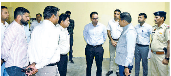
सिरसा। निरीक्षण के दौरान अधिकारियों के साथ बातचीत करते आरके सिंह। किया और आवश्यक दिशा-निर्देश दिए। उन्होंने सभी एआरओ को निर्देश दिये कि मतगणना के दिन राउंड वाइज रिपोर्ट समय पर भेजे

लोकसभा चुनाव को शांतिपूर्ण और निष्पक्ष करवाने को लेकर सिरसा लोकसभा के रिटनिंग अधिकारी एवं सिरसा के उपायुक्त आरके सिंह ने जिला के चुनाव से जुड़े नोडल अधिकारियों की बैठक ली और चुनाव तैयारियों बारे चर्चा की। रिटनिंग अधिकारी ने भीडिया खेड़ा कॉलेज में बनाए गए मतगणना केंद्र और ईवीएम स्ट्रॉम रूम का निरीक्षण