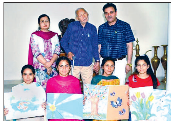
सिरसा। प्रतियोगिता की विजेता मुख्य अतिथि के साथ।