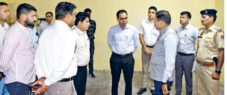
राउंड वार्ड रिपोर्ट समय पर भेजे ताकि रिजल्ट डिक्लेयर करने में देरी ना हो। लघु सचिवालय के सभागार में अधिकारियों की बैठक लेते हुए

लोकसभा चुनाव को शांतिपूर्ण और निष्पक्ष करवाने को लेकर सिरसा लोकसभा के रिटर्निंग अधिकारी एवं सिरसा के उपायुक्त आरके सिंह ने जिला के चुनाव से जुड़े नोडल अधिकारियों की बैठक ली और चुनाव तैयारियों बारे चर्चा की। रिटर्निंग अधिकारी ने भीडिया खेड़ा कॉलेज में बनाये गए मतगणना केंद्र और ईवीएम स्ट्रॉंग रूम का निरीक्षण किया और आवश्यक दिशा-निर्देश दिये। उन्होंने सभी एआरओ को निर्देश दिये कि मतगणना के दिन