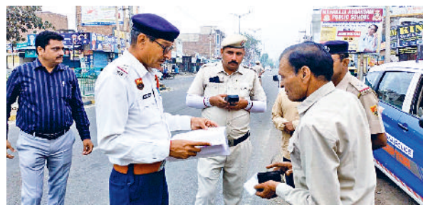
फतेहाबाद। बसों को चेक करते हुए ट्रैफिक पुलिस कर्मचारी।

71 स्कूल बसों के चालान अवैध रूप से चलती मिली 15 टाटा एस बसें