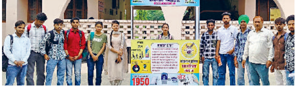
रतिया। खालसा कॉलेज में आयोजित मतदान जागरूकता कार्यक्रम में मौजूद विद्यार्थी।