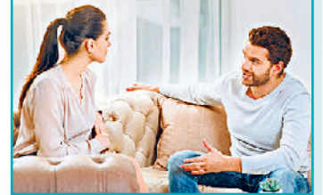
थोड़े से अतिथि सत्कार के बाद उन्हें विदा कर दें। विशेषकर जब आप घर में अकेली हो तो जहाँ तक संभव हो, उन्हें घर के अंदर बैठावें से बचें।

पति की अनुपस्थिति में उनके मित्र से बहुत अधिक समय बात ना करें या रुकने की ना कहें। घर में अन्य सदस्य हैं तो भी