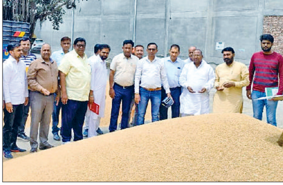
जाखल। गेहूं खरीद का शुभारंभ करते खरीद एजेंसी के अधिकारी।