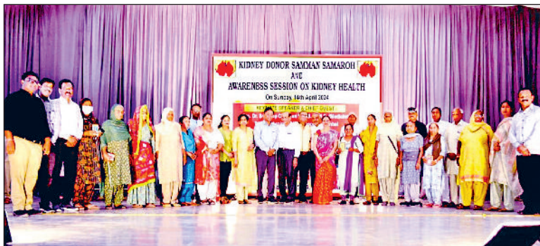
सिरसा। किडनी डोनर को सम्मानित करते हुए संस्था के प्रतिनिधि।

उन्होंने बताया कि किडनी फेलियर को रोकने के लिए हमें हाई ब्लड प्रेशर, शुगर रोग एवं गुर्दे की पथरी का समय पर इलाज करवाना चाहिए। उन्होंने किडनी को स्वस्थ रखने के लिए खान-पान से संबंधित जानकारी भी साझा की व ऑर्गन डोनेशन के बारे में भी अहम जानकारी दी। उन्होंने बताया कि अपना शरीर छोड़ते हुए भी